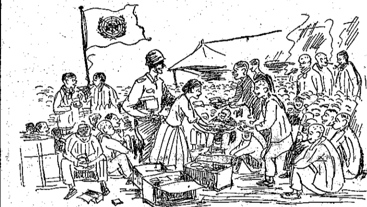
「去回意願不們我，好過待的軍聯」：說都俘虜軍共多很

在韓國的停戰談判中，聯軍代表曾向共方建議立即交換傷病的俘虜，但被共方拒絕了。據最近在日本和韓國旅行一個月後，牧師巴克說：若千韓國的共軍戰俘，都懇求不要把他們遣回北韓或中共區去。傷病的共軍戰俘，已經受到了像醫藥、士兵所享受的這些俘虜的照顧，所有的這些俘虜都得到足量的適口的食物和溫暖的衣服及適當的住所。這也許是他們前此一生中都沒有享受到的。又據美國紐約的一個有名報紙「先鋒論壇」說：北韓的某地，多放棄了他們的土地，偷跑到聯軍防線，每幾達一百人。這些農民，但他們都看清楚的，黨不會留給他們過冬的