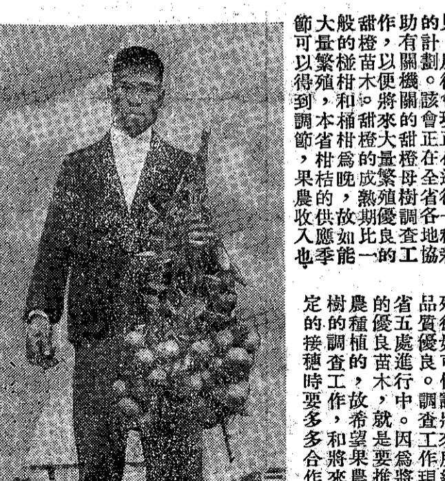
好也質品，多得結實果樹的好。多也入收的農果以所

蔗農貸款辦理甚佳 本年糖產增產可期 復會為了要明瞭蔗農公辦之新台幣七千七百萬元蔗農貸款辦理情形，曾於最近派專家四人實地調查。據稱：這次貸款辦理情形至為良好，預期本年糖產將有顯著增加。此項貸款自去年十月開始辦理以來，已獲下列兩項顯著效果：①今年種植蔗面積，預計可達十萬零三千公頃，較上年蔗時期增加一萬公頃；②提早種植蔗面積，預計全省蔗田面積之