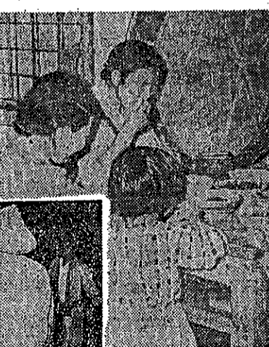
美援鹹魚由糧食局廉價配售全省農民

臺灣省糧食局爲謀增進農民福利起見，特商請安全總署(即以的經合署)美援運用，將由美國新聞處製成底片六套，分發本省各地放映。各地農會或其他團體如備有放映機，可向農復會新聞電教處申請借用影片放映。這部影片是講述本省肥料製造，和美國安全總署和臺灣省政府由國外輸入肥料的情形，以及配給及施用肥料的實際狀況。全部配有音樂，並用臺灣話說明。該片內容確是一部農友們必看的好影片。