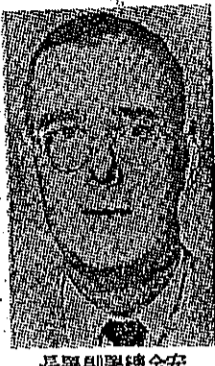
美國共同安全總署副署長畢賽爾

新的共同安全總署(簡稱為安全總署)是一個全世界性的完善機構，由美國國會產生，以遠大的目標，配合一九五二年的世界大局。其使命實比前經合總署更為重大。在遠東方面，安全總署將努力協助自由國家