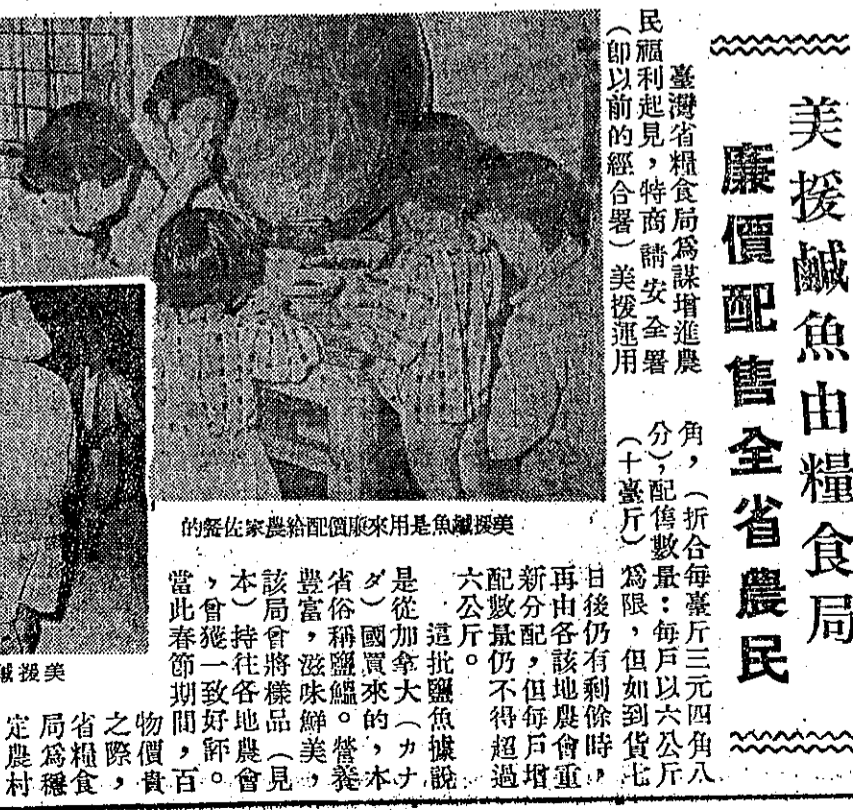
美援鹹魚運到碼頭倉庫

北縣慶祝農節，二月五日舉行。節目中，其中有一項是中山堂初次獻映農復會最近製成之影片，名為「大地豐收」。這部影片在臺北放映以後