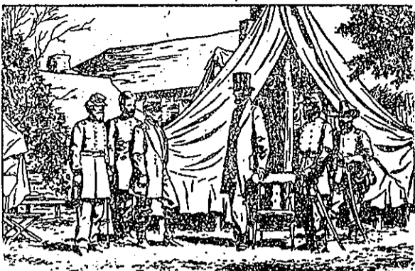
得行執總仗勝打要是可，奴黑的部南放解，示告發肯林(9) 。領將各勵鼓，線前視巡常時肯林，令命道這了