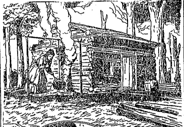
，活生的荒開是的過。裏子房的塔頭木用間一在長生肯林(1) 。情同的人對和氣勇，立自出鑽練