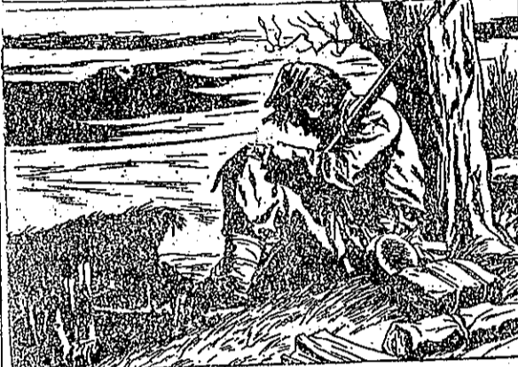
上位尚在，兵士的輕年個一次一有，苦辛兵士個憐很肯林(10) 。免赦令下地特肯林，刑死處判法軍依，着睡