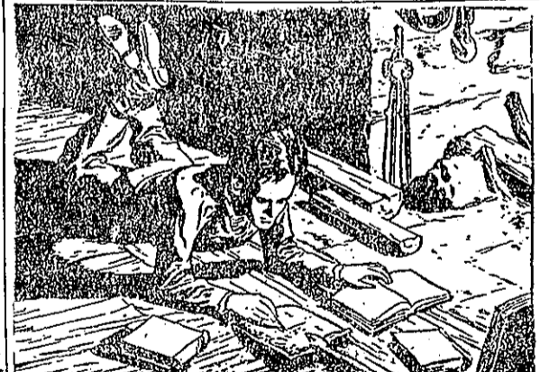
木在炭用就紙有沒，修自上晚，工做裏出在天藍天白肯林(2) 。題問學數習演，字寫上羅