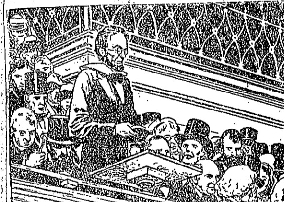
在輕已利勝，候時的統總任二第做始開肯林，年六五八一(12) 存要不都人何任對：說他。仇報要不平和願呼肯林，聖 啓新帝上辯守地決堅，恕仁示表要都人的有所對，意思有 。平和平久永現實力馬，廣創治醫，作工竟完，義正的示