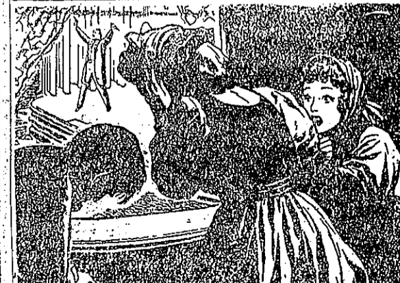
戰在肯林後天五。大寬務必條件令下肯林，後之降收軍南(1) 他失喪然驟，候時的州各結聖要急後戰着當國美。刺被院參 。導領的正公哲明的