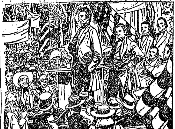
肯林。區地的新到充擴且並，度制奴黑長延張主州既部南(6) 長能不府政的國美：說他。奴廢張主力竭，裏論辯會國在 簽正了有是就，念信重一有該應家天。由自半而歸奴半此有 。任責的已自了盡，能良知良善本該應，力威有繼