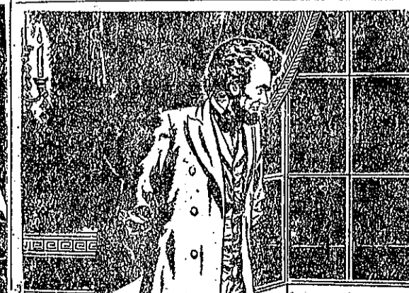
軍軍南河隔見得望高白頓盛華由肯林，仗收場幾了打軍北(8) 。過難很裏心，重慘傷死，戰血軍兩見着他，光火的營