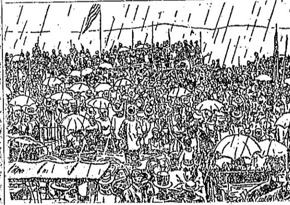
陣方兩念紀做場戰把令下肯林，利勝獲大堡斯在軍北(11) 叫不，心決下立在我們我：說講演表發，莫曉的士將亡 底佑庇帝上在，家國個重要，命生了捐地白白的了死幾遺 於至不，家國的享民治民有民個這要，由自生產新重，下 。滅淪