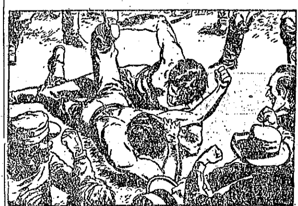
名出很交伴他，服傳人受都器智和氣力，候時的輕年肯林(3) 。名出更才口和筋腦是可，