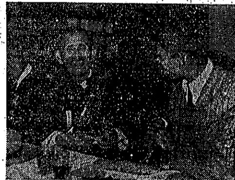
青果社各包裝場 可直接向該社請求

青果社各包裝場 可直接向該社請求 若需要「谷仁樂生」 爲防治外銷香蕉腐爛病，農復會應臺中區青果運銷合作社之請，核贈「谷仁樂生」五十四公斤。現已先撥送其半數二十公斤，供該社各包裝場使用。該社所屬各包裝場可直接向該社各服務所請求。但農會所屬各包裝場如有需要，則可直接向農復會臺北市濟南路一號農復會農業生產組請求。