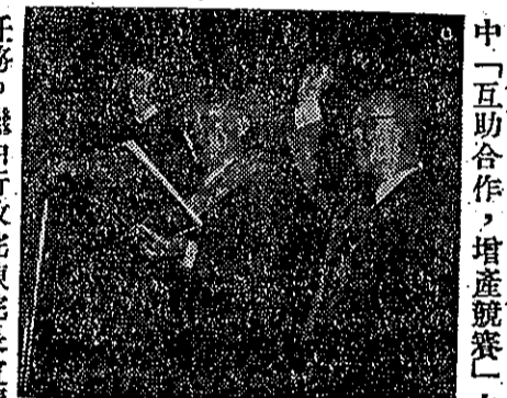
優良農界人士同時受獎