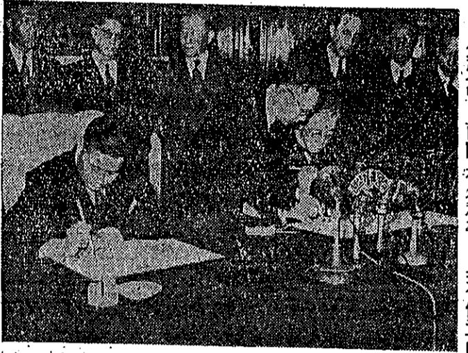
字據上本約在(右)烈河(左)超公葉表代權全方變日中

奠定中日兩國永久和平，具有偉大的歷史意義的《中日和平條約》，經過兩國政府代表兩月餘的談判，已經於五月二十八日午正式簽訂了。