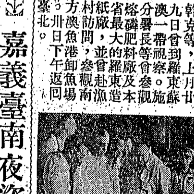
場魚卸港澳力南視參長署分克幹施

共同安全分署長施幹克，率領視察團，於五月廿九日，視察羅東蘇澳一帶。視察團在羅東，視察了該地的治安，及居民的生活。在蘇澳，視察團視察了該地的漁業，及漁民的生產。視察團對羅東蘇澳一帶的治安，及居民的生活，表示滿意。