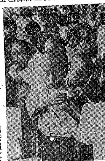
情形射注防預孩結肺施實童兒對

五月一日，日本發生流血大暴動。思想激烈高呼反美口號的青年學生，和韓國共產黨領導下的群眾，五月一日下午在東京皇宮廣場與警察發生衝突，美國遠東空軍總部的玻璃也被打破一部分。據日本內閣官房長官說：暴動顯然是日共軍事行動的一部分。美國駐日本大使麥菲也相信：這僅是日本少數暴徒的陰謀，而不能代表大多數日本人民的情緒。