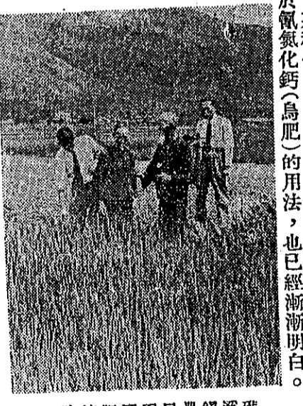
時適肥配因民農鎮溪礁。色於形喜而好長成禾稻

本刊藍總編輯等視察時農民說：今年第一期稻作肥料分配提早，宜蘭羅東一帶農友表示非常滿意，對於氮化鈣(鳥肥)的用法，也已經漸漸明白。