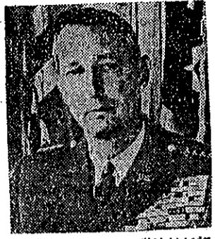
軍將克拉克帥統軍聯韓境新任

杜魯門總統於四月廿八日任命李奇威將軍為歐洲聯軍最高統帥，美國地面部隊總司令克拉克上將則繼任李奇威在遠東的遺缺。又歐洲聯軍最高統帥艾森豪威爾將軍，為了參加競選共和黨的總統候選人，前日已向杜魯門總統提出辭職。他的辭職將於六月一日發生效力。