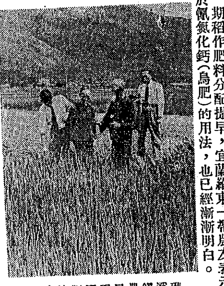
時適肥配因民農鎮溪礁。色於形喜而好長成禾稻

本刊藍總編輯等視察時農民說：今年第一期稻作肥料分配提早，宜蘭羅東一帶農友表示非常滿意，對於氮化鈣(鳥肥)的用法，也已經漸漸明白。