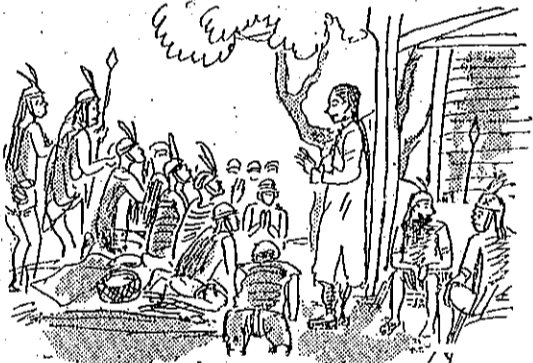
敬尊與任信人蕃得頗 (6)