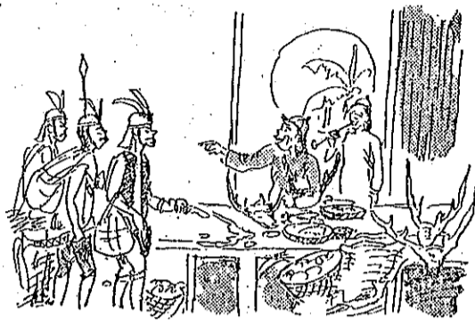
正不敗腐污貪事通任前 (4)