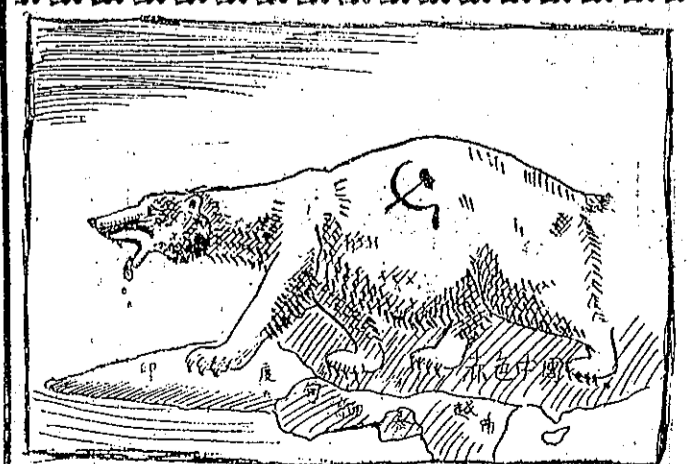
(作樂金) 路死我自於等——距南東的熱炎入侵，熊極北之中冷寒於生俱