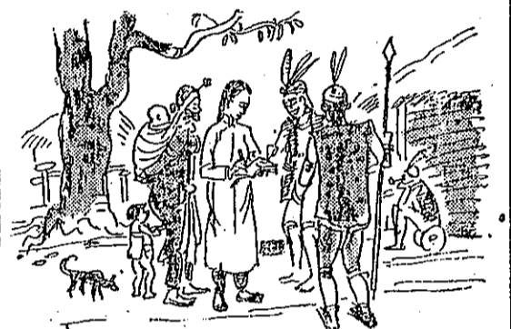
言語與慣習俗風人蕃究研 (2)