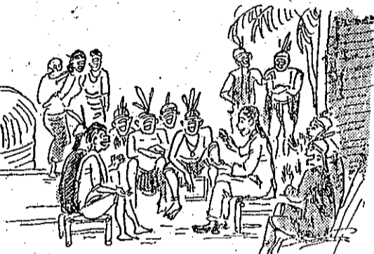
活生其善改並人蕃養教鳳吳 (5)