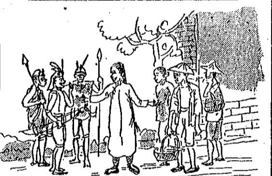
(官譯翻)事通任時歲四廿 (3)