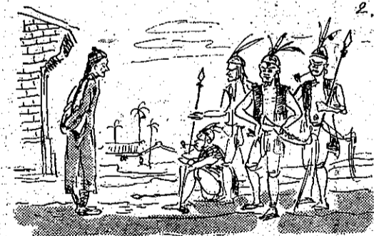
神祭人殺求要們長會 (2)