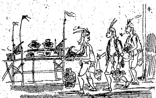
神祭頭的畜牛用改 (4)