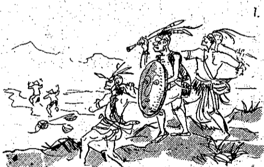
信迷又殺好性人善 (1)