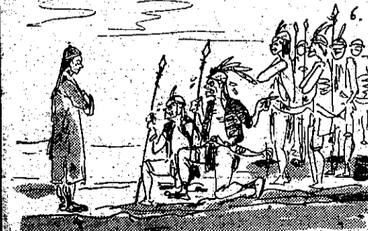
聽不動苦鳳吳神祭人殺張主仍後最 (6)