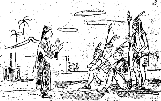
人殺草出要不們他告勸鳳吳 (3)