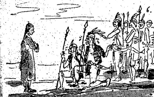
聽不動苦鳳吳神祭人殺張主仍後最 (6)