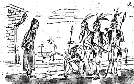
神祭人殺求要們長會 (2)