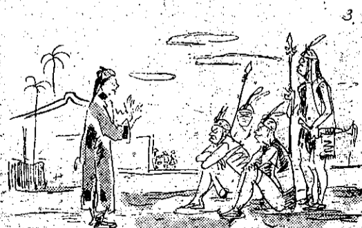
人殺草出要不們他告勸鳳吳 (3)