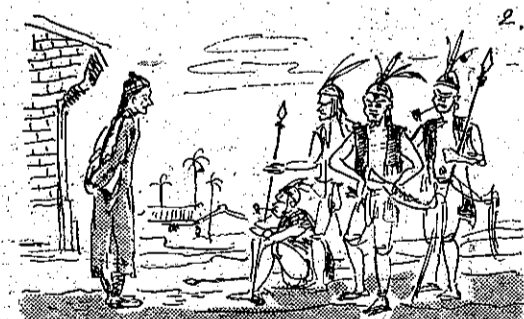
神祭人殺求要們長會 (2)