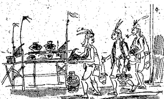
神祭頭的畜牛用改 (4)