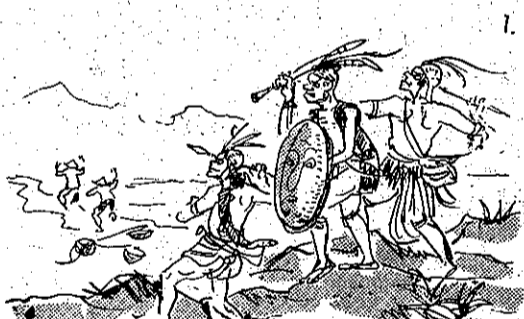
信迷又殺好性人蕃 (1)