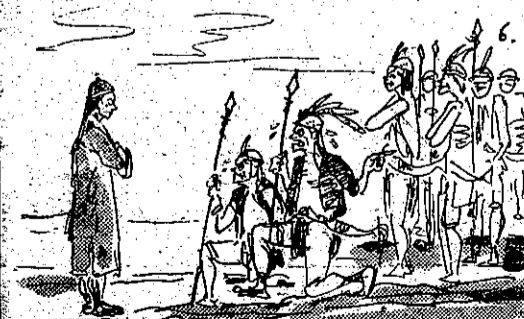
聽不動苦風吳*神祭人殺張主仍後最 (6)