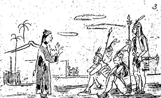
人殺草出要不,們他告勸風吳 (3)