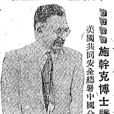
美國共同安全總署中國分署署長施克博士

今後須發展工業 美國共同安全總署中國分署署長施克博士，五月廿九日在臺北演說。他認為臺灣的農業，已經有良好基礎，今後應發展工業。