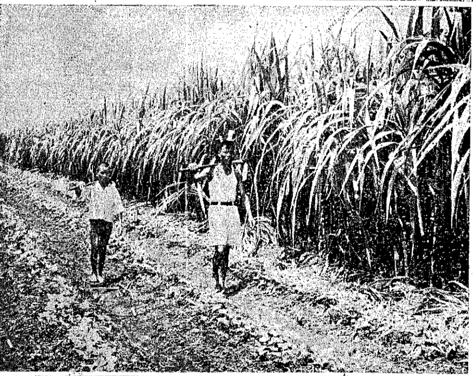
③他的田地除了種植水稻之外，也種些甘蔗和蕃薯，可以出售，也好養畜。他的子姪正工作完畢回來。