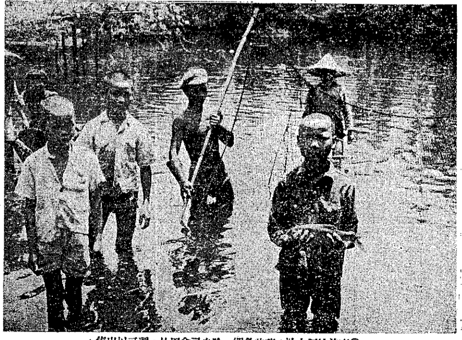
⑤售出以可還，外用食己自餘，蝦魚些養，池水個挖前庭