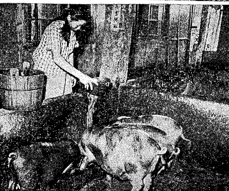
②此外更養有四十幾隻肥豬，是農作以外的主要副業，也是衛生堆肥的一大來源，這些工作都由婦女們負責的。