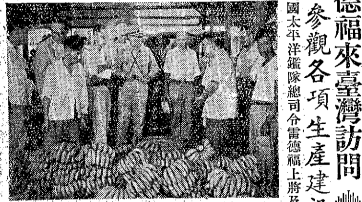
雷德福將軍參觀水坑里香蕉集場

美國太平洋艦隊總司令雷德福上將及夫人，於十月十五日來自由中國訪問。雷氏此次是應美國共同安署之請，來臺灣參觀各項生產建設。雷氏於十月十七日往苗栗參觀附近的出礦坑油井，並往臺中參觀農復會協助的計劃。於十八日往日月潭參觀發電設施，以水裡坑一帶，香草、鳳梨等青果生產情形。雷氏於十九日往高雄參觀機械工廠等。雷氏已於廿日晚間結束其為期六天的二度訪問臺灣日程，於廿一日晨九時離臺返防。