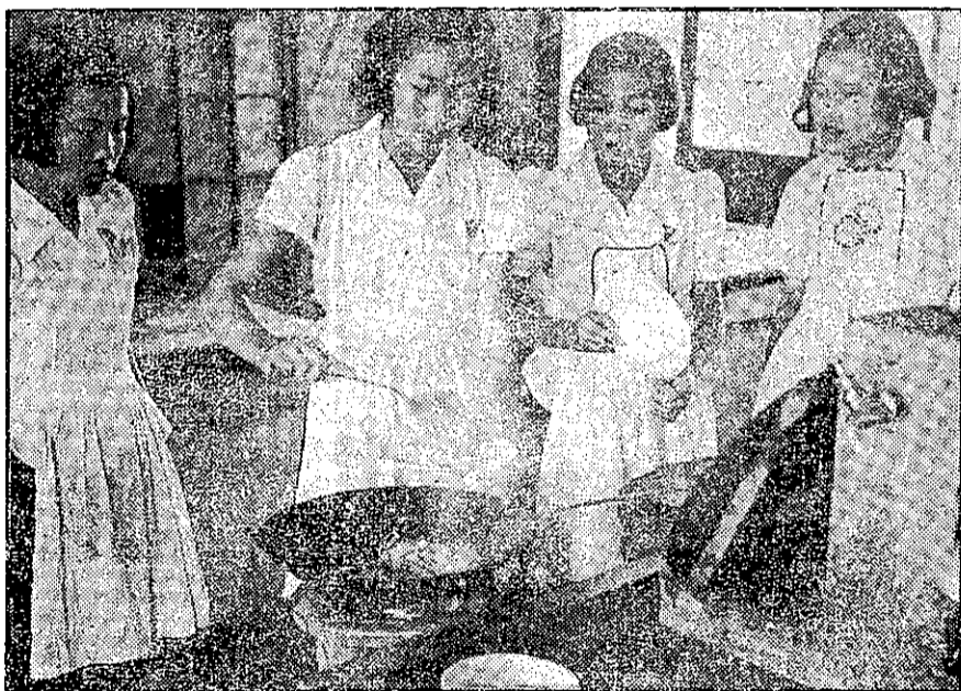
做菜非但要色、香、味俱佳，同時還要注意營養和經濟。烹飪課便是訓練她們學習這些技能和知識的。