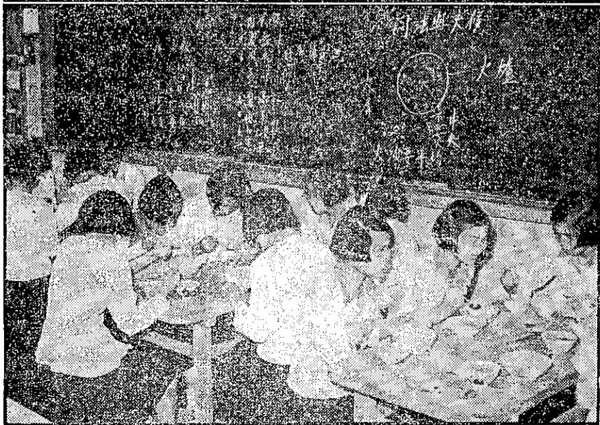
上完了烹飪課便是一頓很好的午餐，藉以嘗嘗自己所做的飯菜是否可口，同時吃飯時的姿態和禮貌也是必要練習的。