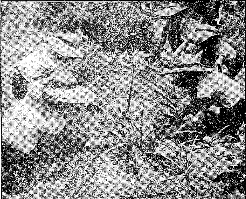
栽培花木也必須學習，這是接近自然的戶外課程。