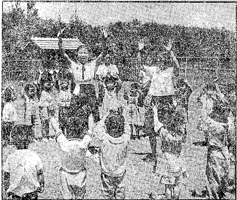
立縣南臺是這。識知兒育輸灌，力能業就養培課育伴童兒 。形備唱遊兒導領生習實所兒托設附職家