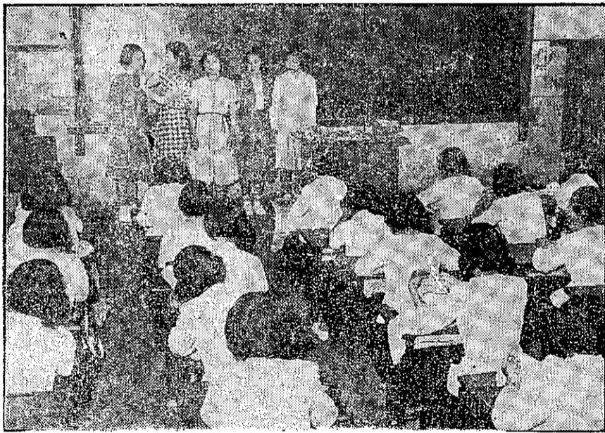
臺中市立家職還附設補習班，除了程度較深外，還有接待的禮節和化裝的技巧等課程，這裡正在講授關於各種環境的服裝的形式和修飾技術。