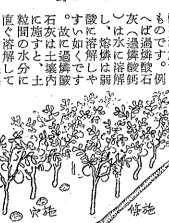
過磷酸石灰は條施或ハ穴施ニシテ効果が大きい。