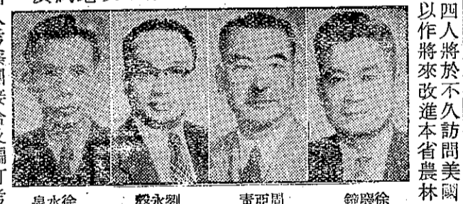
省府官員赴美考察

省府將赴美考察，並謂，省府將赴美考察，並謂，省府將赴美考察。省府將赴美考察，並謂，省府將赴美考察。