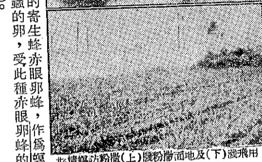
泥脫除草劑(上)及(下)噴灑情形

防止棉田野草 美國農業部的專家，由一種新發明，在棉田中噴灑一種名曰「泥脫」的除草劑，即可防止棉田內野草的發生。據美農部最近說：這種最新除草劑，在過去一年中，經過試驗，其效果非常顯著。在試驗中，如果試驗成功，則在時間上說，以後，才可能大規模的推廣。現在，在棉田中噴灑「泥脫」除草劑，其效果如下：(一)在一年中，不必再經過兩次除草，(二)在一年中，不必再經過兩次除草，(三)在一年中，不必再經過兩次除草。