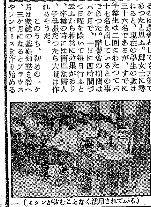
(農會中勤儉節約的婦女)

將勤儉 屏東縣九如鄉，是去年農會的主催，村中婦女們，為了改善生活，組織了農會。她們通過勤儉節約，發展生產，提高了生活水平。這是一個值得借鑒的典範。