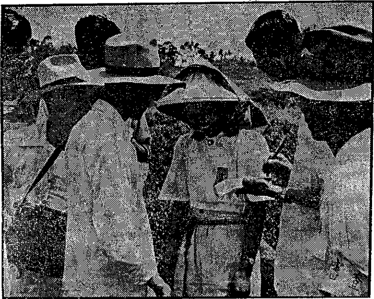
審茶員把比賽的人茶籃集中，然後送到審查地方。

這次的競賽，雖然祇限於苗栗一縣，規模並不算大，但是對於提高生產技術，促進農業增產，確有很大作用。因此各界甚為注意，各報記者也多趕到實地採訪。