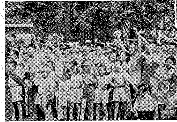
呼歡道災衆民時過經統總

全省五十六處千二百坪 農林廳在本年度計劃補助農民設置混凝土晒場，計新竹縣四處八坪，苗栗縣六處一、二〇〇坪，臺中縣四處八〇坪，彰化縣七處四〇坪，南投縣二處四〇坪，雲林縣三處六四〇坪，嘉義縣三處六四〇坪，臺南縣六處一、二〇〇坪，臺南市二處四〇坪，高雄市二處四〇坪，高雄縣一處四〇坪，屏東縣一處四〇坪，花蓮縣一處四〇坪，台東縣一處四〇坪，澎湖縣一處四〇坪，金門縣一處四〇坪，馬祖縣一處四〇坪。