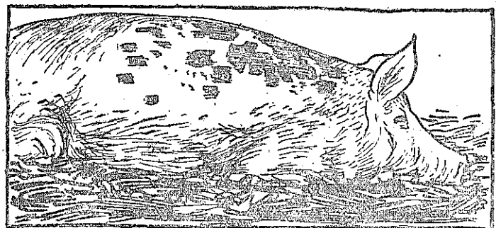
斑色狀塊生發上病度，豬的丹毒染發

徵狀是僵直、行步不穩，按摸患部有疼痛的反應。在沒有色素的皮膚上，可以見到紅塊，但豬瘟也可能有相同的色塊。這種色塊，生前不易覺察，患部皮膚上的毛豎立，有粗糙的感覺。吃奶的小豬，尾巴和耳尖可能乾燥脫落，可在幾天以內死亡。否則，也可能局部復元。 慢性的豬丹毒，沒有精神萎靡和食慾不振等病徵。只是僵直和四肢關節周圍的腫脹，這種腫脹也可以變成硬塊而引起關節的扭轉。小豬發生關節炎之後，雖然死亡率很低，但復元的也很少。這種小豬經常是很瘦的，