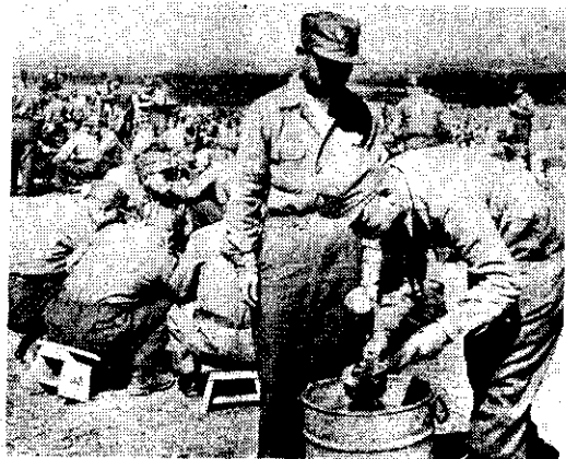
飽飯足茶餐進士義