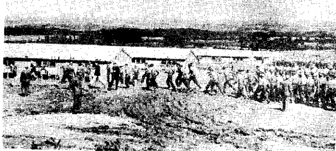
各地同鄉會慰問同鄉義士