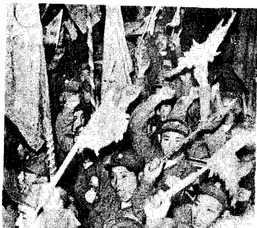
號口呼高們士義中會迎歡