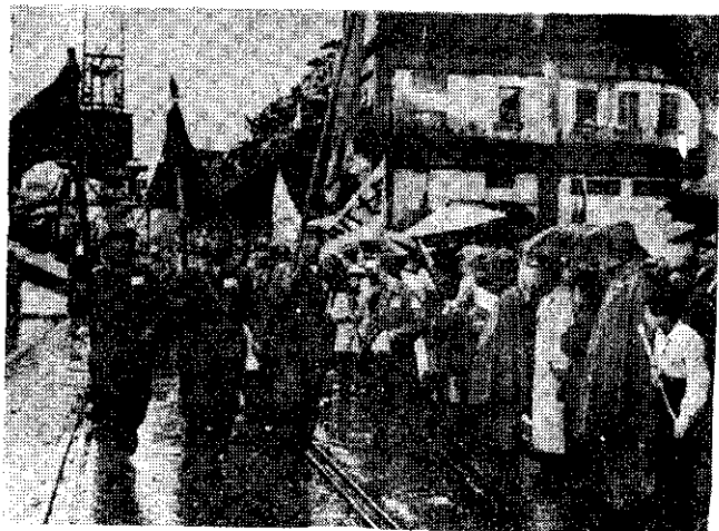
迎歡兩冒衆民時岸登們士義