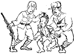
行了動熱的徑，他飛也似地往前跑，大地死了一

那是小牛被派出去偵察匪軍情報的一個傍晚，西天現出一道疲倦的金光，晴空點點美麗的歸帆，山峰吞噬了炎熱的火傘，夜幕已經漸漸展開。小牛在山上辭別了大家，踏上征途，行行復行行，已經是夜深了，這時萬籟俱寂寒風刺骨。他祇穿着一件破爛的衣服，身上不帶任何東西，他化裝成一個窮苦的孩子，去探聽敵人的