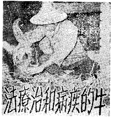
長所所分驗試產畜春恒