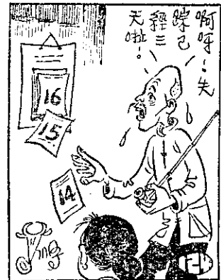
啊呀！先 牌已 天啦！