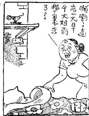
啊呀！這 麼天早 牛大姐到 那裏去 了？