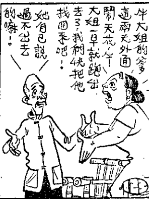
她自己說 過不出去 的嘛！