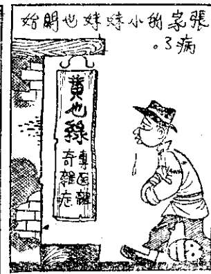
始朋也對時小的象張 。了病