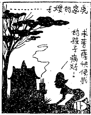
半苦薩快使我 的孩子病好！