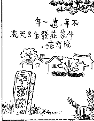
年一這，幸不 花天3全發莊象牛 。症行院