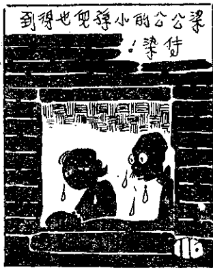
到得也兒孫小的公公梁 ！梁付