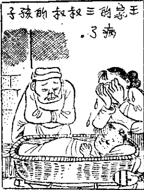
子孩的叔叔三的象王 。了病