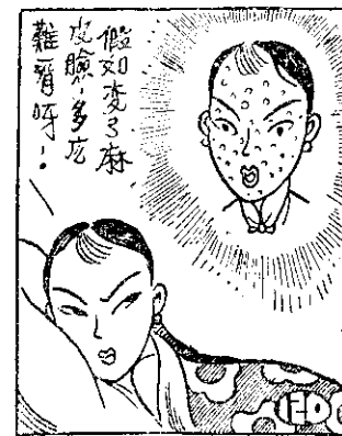
假如變了麻 皮臉，多吃 雜糧呀！