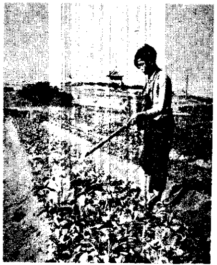
蔬菜噴射除蟲藥粉

金門全島土質貧瘠，樹木稀少，雨量不足，一片旱田，小麥、甘薯、花生、高粱等為僅有的農作物。自從國軍進駐該島，軍民合作，努力生產，其後並得農復會資助，建設水壩、倉庫、農場、贈送大批肥料、樹苗、米苗、種子、藥品等，並派員前往指導後，農業技術大進，生產增加，農民生活改善。圖示農復會在金門工作的一部分，將來水利工程完成後，金門的前途是可預料的。