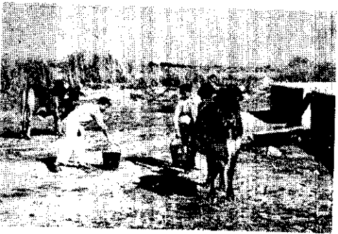
兩頭由蘇運來的印度種公牛