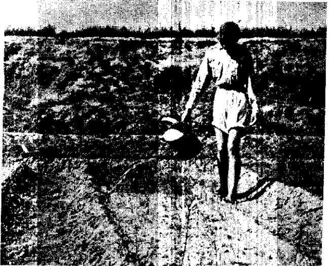
工人灌溉新栽的樹苗

金門全島土質貧瘠，樹木稀少，雨量不足，一片旱田，小麥、甘薯、花生、高粱等為僅有的農作物。自從國軍進駐該島，軍民合作，努力生產，其後並得農復會資助，建設水壩、倉庫、農場、贈送大批肥料、樹苗、米苗、種子、藥品等，並派員前往指導後，農業技術大進，生產增加，農民生活改善。圖示農復會在金門工作的一部分，將來水利工程完成後，金門的前途是可預料的。