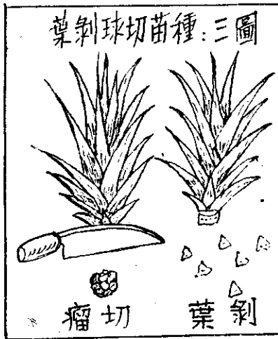
葉剝球切苗種：三圖