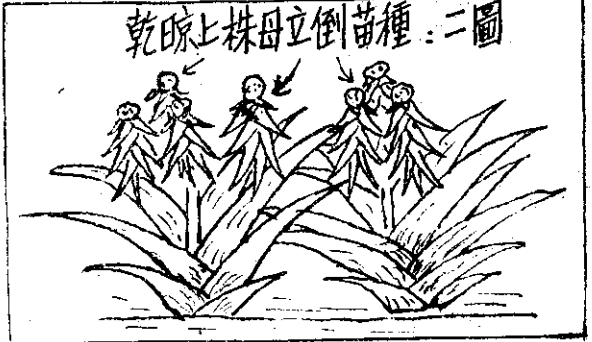
乾晾上株母立倒苗種：二圖

① 種苗的乾燥：一般鳳梨苗沒有乾燥，種植後發根生長也都可以。但種苗乾燥最少下面兩個目的：一爲防止病蟲害的發生，種植前種苗要經過燻蒸。燻蒸時種苗若沒有晾乾，很容易發生藥害。乾燥的程度以葉片不易折斷爲度。(晴天約四、五天)另外一個目的，就是裝運或貯藏時可以防止種苗的腐爛，遠途運輸時或貯藏時，乾燥程度要高些，短途運輸時不必過於乾燥。(裝運或貯藏前不要淋濕，否則必發生嚴重的腐爛)