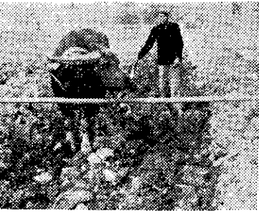
形情的耕深行實者作文本

總而上述方法絕不是完全理想，只望把我所做過的經驗供大家來互相研究而已。嗣後我對於我的農場經營的目標，是除了栽培兩期水稻外，冬作三分之一要栽培甘藷(糊仔)、小麥等什糧，三分之一預定栽培綠肥，殘餘三分之一是犁起後休閑風化，而漸次深耕改良地質。用這樣的作法以維持地力，和對增產的配合，我認為是很理想的。(請參看作者第二次犁起「牛踏隔土」的相片)