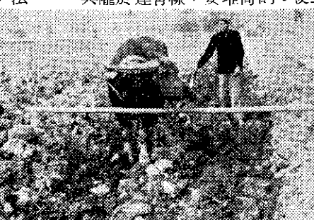
形情的耕深行實者作文本

總而上述 方法絕不 是完全理 想，只望 把我所做 過的經驗 供大家來 互相研究 而已。嗣 後我對於 我的農場 經營的目 標，是除 了栽培兩 期水稻外 ，冬作三 分之一要 栽培甘藷 (糊仔)、 小麥等 什糧。三 分之一預 定栽培綠 肥，殘餘 三分之一 是犁起 後休閑風 化，而漸 次深耕改 良地質。 用這樣的 作法以維 持地力， 和對增產 的配合， 我認為是 很理想的 (請參看 作者第二 次犁起「 牛路隔土 」的照片)。