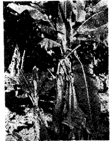
(一圖) 發生萎縮香蕉病。注意：葉片邊緣變色。①被植葉小狹幅。②被植葉小狹幅。③被植葉小狹幅。