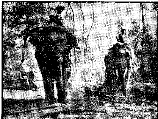
泰國村童騎在高大的象背上與騎在牛背上的臺灣牧童同樣的悠然自得。

在緬甸和安南之間，有一個被稱做「白象王國」或「佛象王國」的泰國，她目前自由世界人士特別注意的國家，因為在越南停戰以後，共產匪徒正密謀把她做為下一個侵略的目標。 泰國從前叫做暹羅，在我國清朝乾隆年間，曾被緬甸滅亡，由我僑胞起