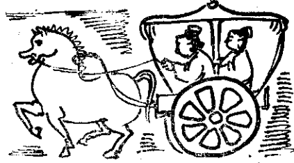
⑦ 孔子五十五歲時因當時禮樂破壞，社會不寧，所以周遊列國去遊說，希望實行自己的理想來拯救天下，一共十四年才回魯國。