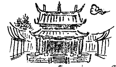
⑧ 孔子卒於魯哀公十六年，七年時，將其田宅立廟祭祀，並設置看守的人以示崇敬，是為孔子廟的開始。