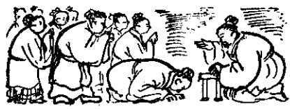
⑥ 孔子卅多歲開始收門徒，到五十多歲時，已有學生三千多人了，其中有名者有七十二人，而子路、子貢、子夏、子由等是他得意門生。

有二十多歲時，已名於天下，有七十二名弟子，其中知名者有七十二人，而子路、子貢、子夏、子由等是他得意門生。