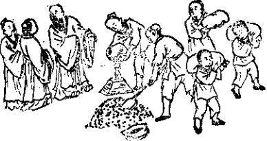
④ 孔子主張天下無不為之，幼時，都應各得其所，所以常將其所得的倉祿分贈貧苦的門人。