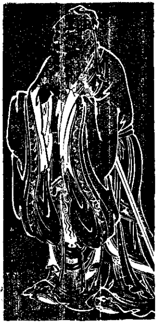
① 孔子名丘，字仲尼，春秋時魯人，生於周靈王廿一年冬，離現在有...

有二十多歲時，已名於天下，有七十二名弟子，其中知名者有七十二人，而子路、子貢、子夏、子由等是他得意門生。