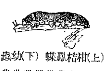
柑桔鳳蝶(上) 幼蟲(下)