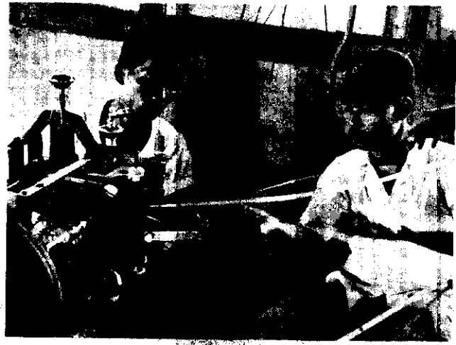
這是一架農復會補助的劈竹機。