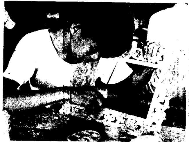
製品的樣式不但要新穎，還須古樸。