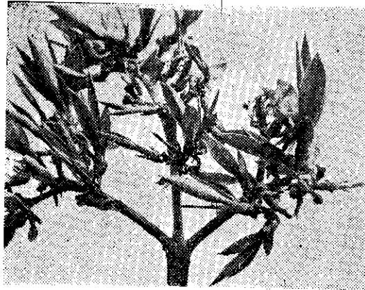
芽珠的生着上軸花麻瓊(上) 。芽蘗的出發旁株老麻瓊(下) (一圖)

常栽植後六—八年，開始抽出高約四—五公尺的花軸，應在離基部二—五公尺左右處，用刀切斷，抑制生長，免受風災折斷吹落，好使着生的珠芽碩大健全，採苗工作容易進行。每株花軸着生