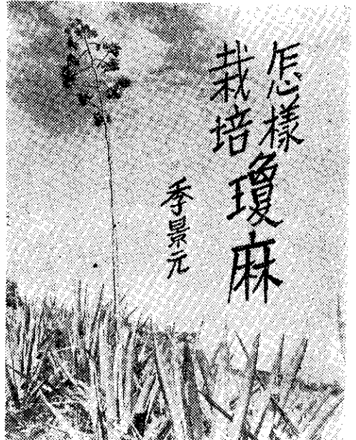
長所芽蘗是，株麻小的長生邊旁株老麻瓊 。芽珠是的生着上軸花。的成

瓊麻(シサル)的正確名稱，據農業專家蔣詠延先生的意見，應該是神麻，本刊為通俗起見，還是應用習用的名稱。