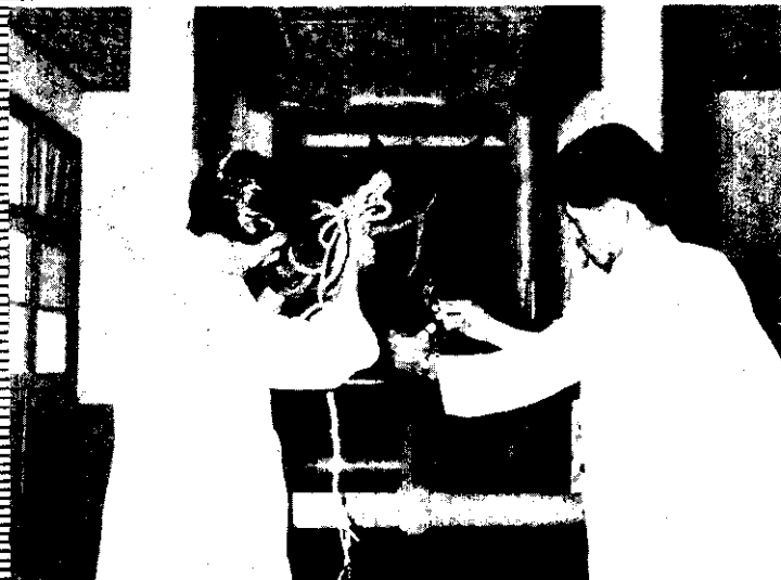
獸醫為生病的馬抽血驗