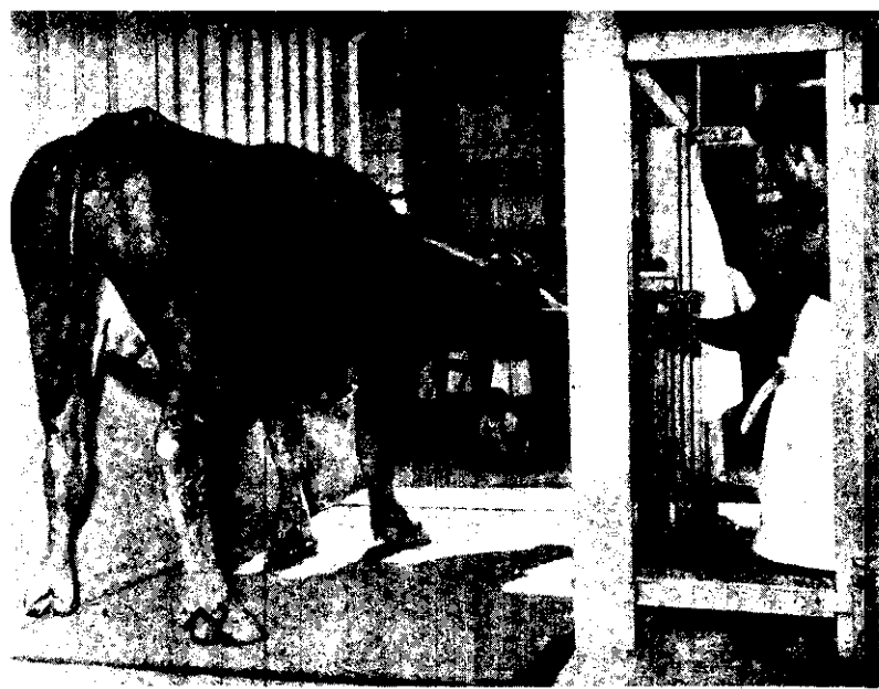
牛在板上走過就可秤出重量