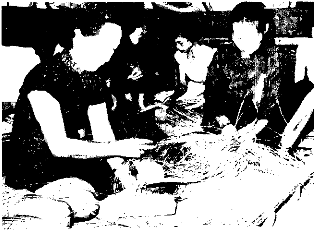
兩雖她，（右）某查高的演表織編範示加參選被。秀優很却偷技，明失目