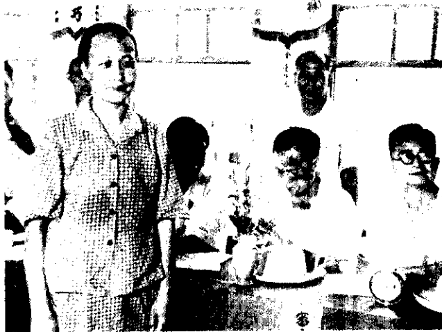
內鐘分二十四又時小個四在，英劉蔡的快最織編。帽軍子童的亮漂頂一成織，