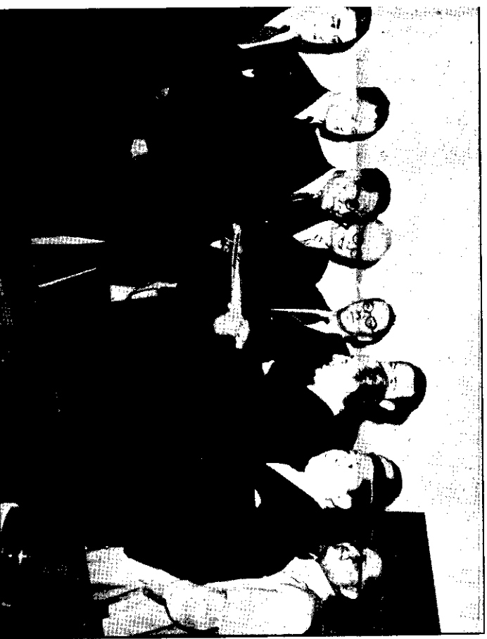
亞瑟總防衛條約和太平洋憲章，於一九五四年在馬尼拉會議中訂立，並已得參加各國 批准。圖示菲律賓駐聯合國代表萊拉諾（左起第三人）將這兩項文件送交聯合國備案的 。