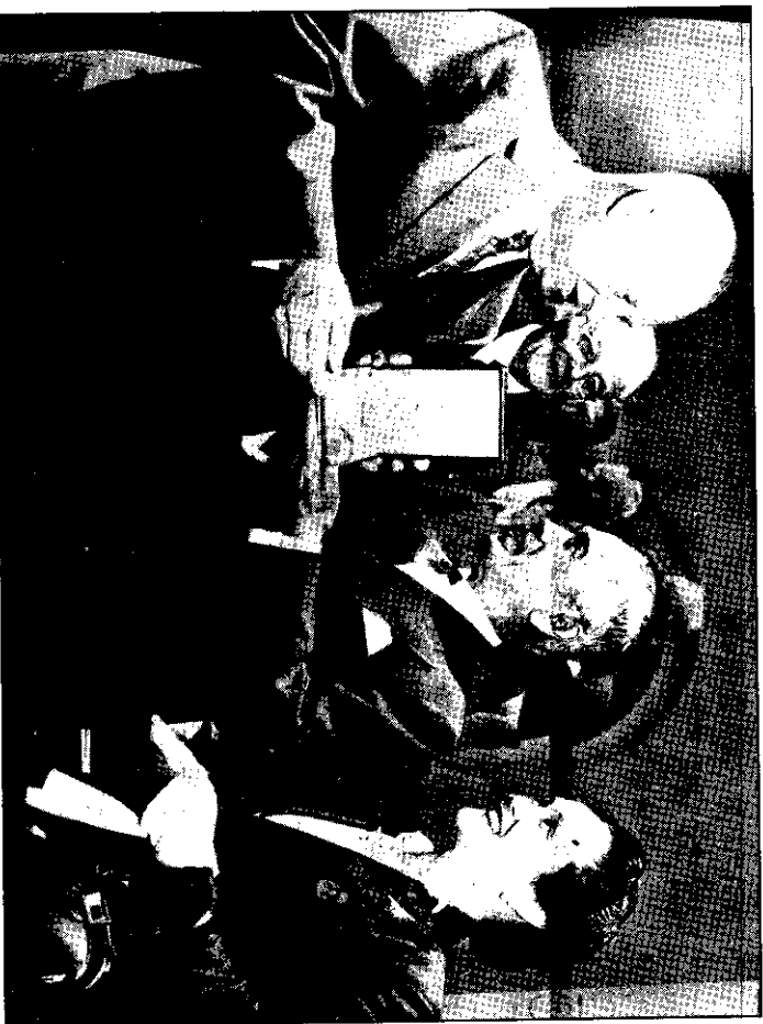
美國總統艾森豪威爾（左），於泰國總理曼披汶最近訪美國期間，以榮譽勳章贈予曼氏。 旁觀者為曼披汶夫人（右）及美國國務卿杜勒斯（左第二人）。