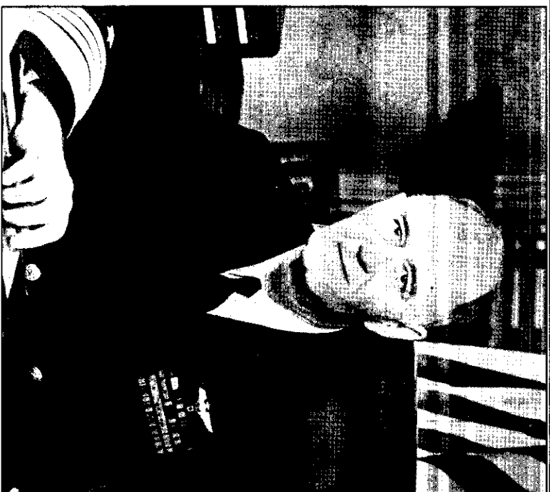
美國海軍上將史敦普將軍，最近奉派為馬尼拉公約理事會美國理事的軍事顧問。史氏仍將繼續担任美國太平洋艦隊司令的職務。