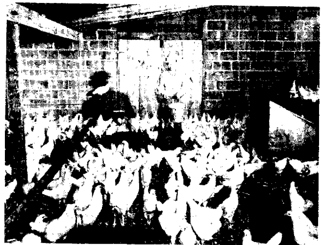
三千隻來亨鷄都由他照料。