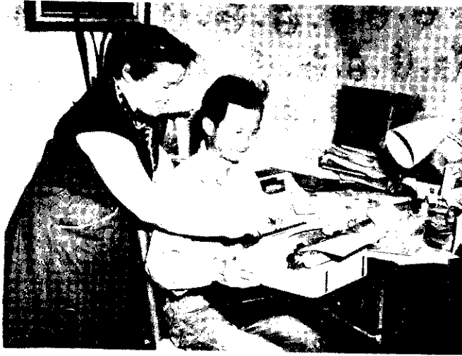
梅太太教他使用打字機。