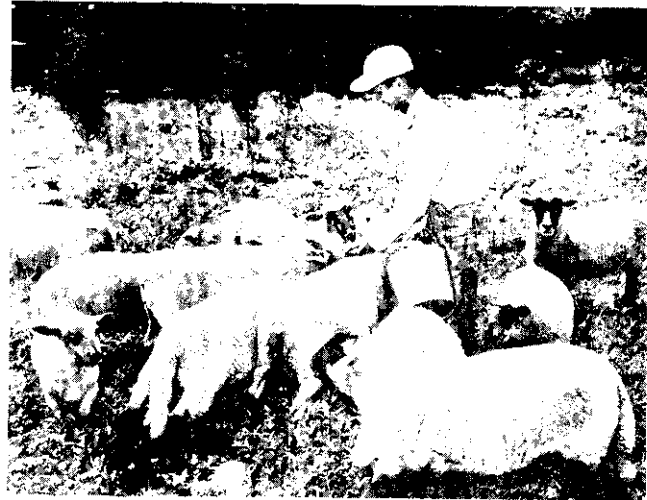
林君平時最愛羊群。