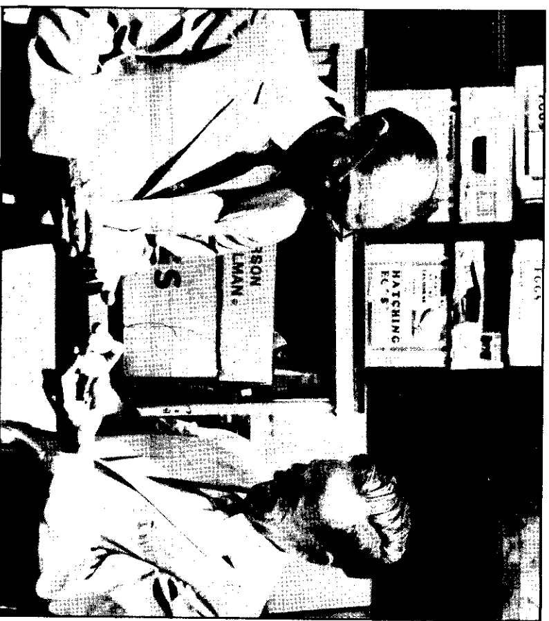
一千個用作孵卵的雞蛋，運抵卡拉蚩市，以協助提高巴基斯坦的雞蛋生產和家禽水準。圖中檢視雞蛋的人，是巴基斯坦農業發展局長阿富沙爾（左）及美國對外工作總署職員貝爾德。