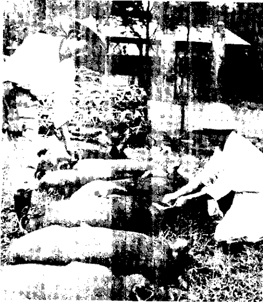
檢疫很嚴格，合格後才可以裝籠。