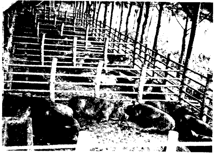
。閑悠的刻一後最受享，裡所疫檢在豬毛

今年年初，農復會從美國買來幾架小型曳引機，給農友試用。試用期為一年，如果成績好，將來可能推廣。臺灣農業不是適於機械化，不是久以來的問題，這爭論的問題，這次試驗以後，當可得到初步的結論了。 下圖：在講習會中，農民學習曳引機的使用方法。 右圖：這是一架比較大的曳引機，不容易駕駛。