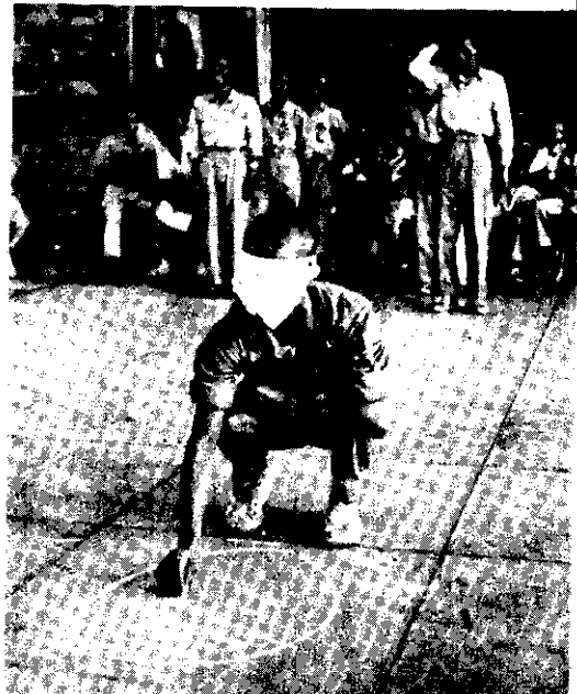
這群未來的四健指導員，正在學習一種團體遊戲。

臺灣四健會當局，於本(十)月上旬在全省分三區舉辦學校四健會助理指導員講習，這次講習特別注重康樂訓練。北區於十月一日起在桃園農校舉行，一共四天，參加的人特別多，節目也特別精彩並富教育意義。