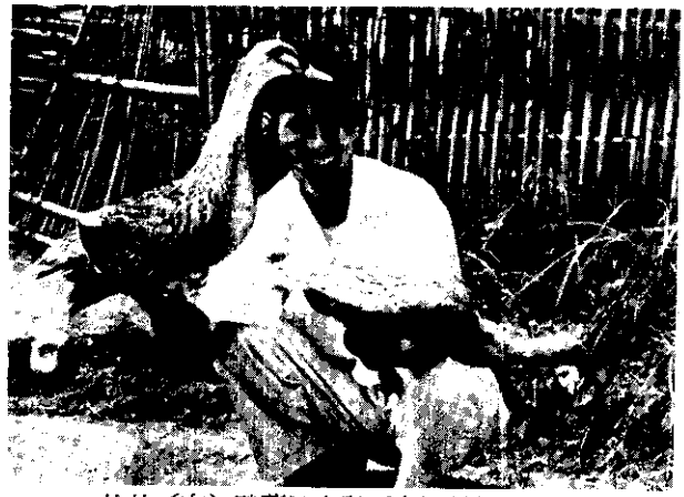
比的(右)鴨菜地本與(左)種雜代一鴨平北 上以斤台一差相，較