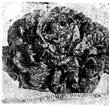
種品(Wayahead)苜蒿心卷型合抱