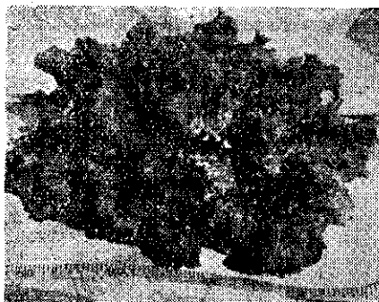
種品(Black Seeded Simpson)苜蒿葉刈

區別，但都有栽培價值。品質清爽脆嫩，最適宜生長。抱合型代表品種 Wayahead (ウェイ・ヘッド)