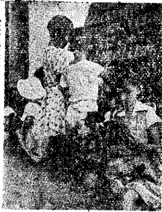
一羣小朋友圍着圖畫

連環圖畫就是一種有連續性的圖畫故事，因為這種故事圖多字少，就是識字不多的人以及兒童都能了解，所以非常受人歡迎，也非常通俗。無論什麼報章雜誌中總有幾幅連環圖的