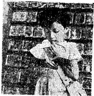
摸過了辭書的辭手又放到嘴裡去。你看多麼的餓呀！

連環圖對兒童是有這樣的壞影響，為了兒童將來，心理的健康，我們做父母的怎樣能不注意呢？所以你有責任禁止孩子去看那些荒唐不好的連環圖畫，只是禁止兒童看那些連環圖畫，也許會引起他們好奇的心理，反而更要偷偷的去看的辦法，還是介紹些良好的讀物，讓他們吸收一些精神上的好營養，希望你不要忽略了這個嚴重問題。