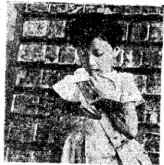
摸過了辭書的辭手又放到嘴裡去。你看多麼的餓呀！

連環圖對兒童是有這樣的壞影響，為了兒童將來，心理的健康，我們做父母的怎樣能不注意呢？所以你有責任禁止孩子去看那些荒唐不好的連環圖畫，只是禁止兒童看那些連環圖畫，也許會引起他們好奇的心理，反而更要偷偷的去看的辦法，還是介紹些良好的讀物，讓他們吸收一些精神上的好營養，希望你不要忽略了這個嚴重問題。