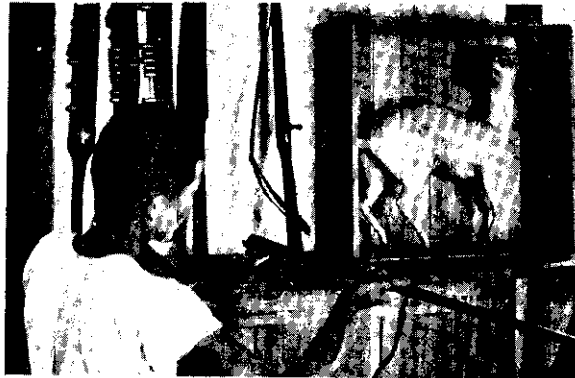
。責負門專兒孫個五由獵狩