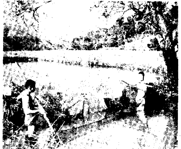
。吃魚有仍，頂山居高