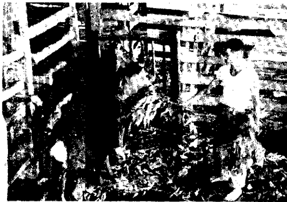
。業副的要主是鹿養