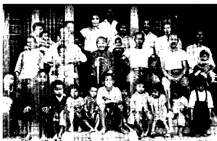
代二第和代一第是中當，份部一的口人家全是這 。代三第是面後，代四第排一前，