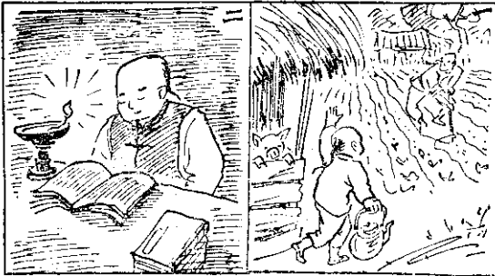
(二) 國父七歲時在塾讀書，經典對武周公及孔。孟道之，非常飲佩。